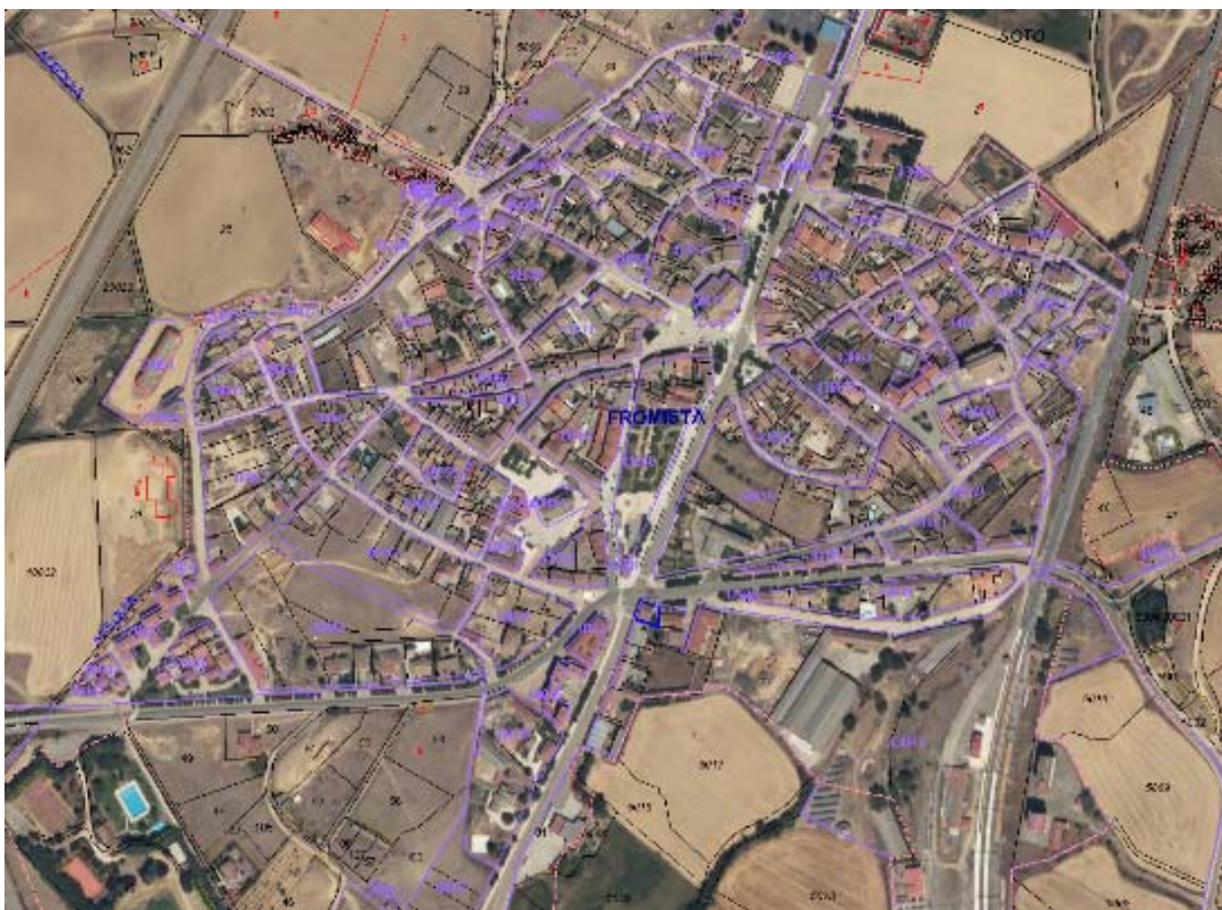
Vista aérea del municipio de Frómista